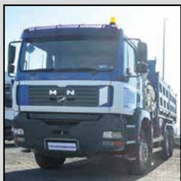
MAN 33.464 anno 2003, km 343800, ribaltabile con gru bonfiglioli p20000 xl. trattativa riservata RIF. RDCK178