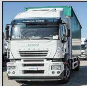
IVECO STRALIS AT260S35 anno 2004, cassone centina e telone (7,10 est.), copri e scopri, scorrevoli, portelloni post., freni e frizione nuovi, ottime condizioni generali. € 25.000,00+lva - RIF. RDCN042