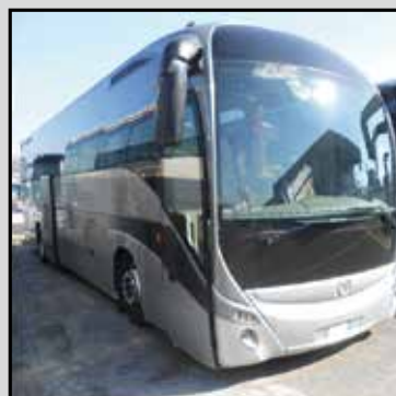
MAGELYS HD anno I immatricolazione 2008 versione gran turismo euro 5