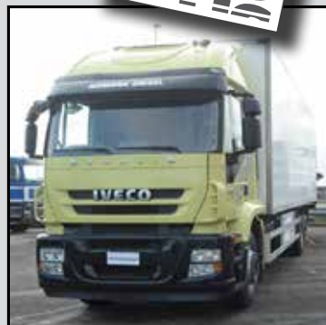
IVECO STRALIS 260S35 anno 2008, isothermico con frigorifero, km 575000, ricondizionato, freni e frizione nuovi, gommatura nuova, cassa in ottime condizioni. € 67.000,00+lva - RIF. RDDR858