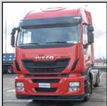
IVECO STRALIS 440S46 EEV anno 2014, trattore, cambio automa- nico con intarder, km 0. trattativa riservata RIF. RDET264