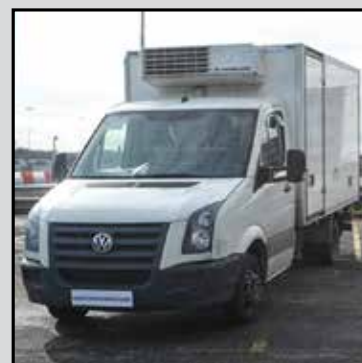
VOLKSWAGEN CRAFTER anno 2011, isothermico con doppio frigorifero, paratia, atp scadenza 03/2017. € 13.000,00+lva RIF. RDEH127