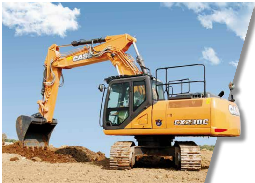
CASE: ESCAVATORI CINGOLATI «SERIE C»