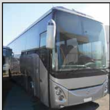
EVADYS anno I Immatricolazione 2009 euro 5