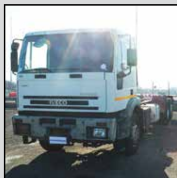
IVECO EUROTECH 260E31 anno 2001, telaio, km 458000, varie unità. A partire da € 8.000,00+lva RIF. RDBX716