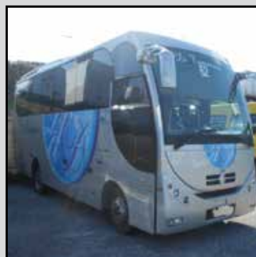
MINIBUS JENUS anno I immatricolazione 2010 euro 5 posti 33 + hostess + autista