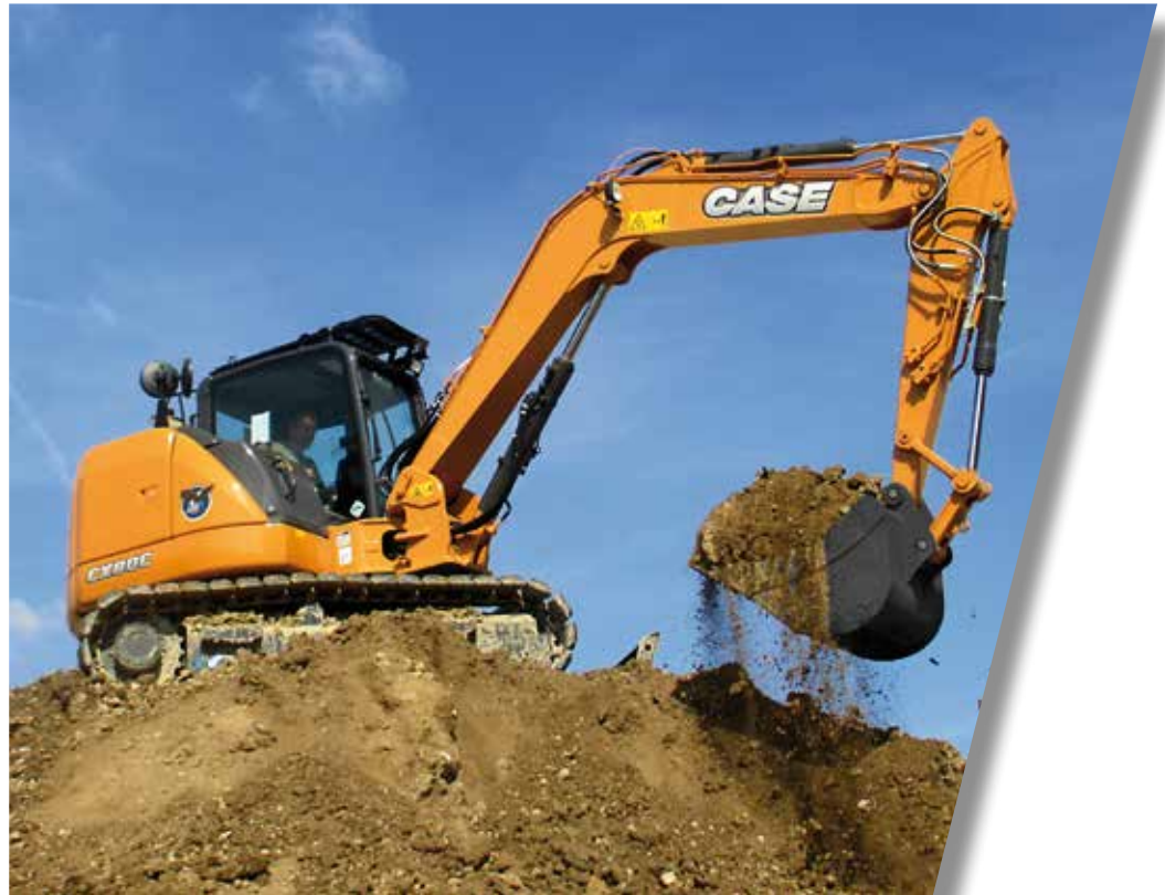
CASE: MIDI ESCAVATORI CINGOLATI «SERIE C»

Assistibilità veloce ed intuitiva (al top dell'indice SAE), motore Tier IV Final e 3 modalità di lavoro per consumi contenuti.