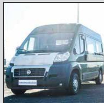
FIAT DUCATO FURGONE VETRATO anno 2014, 33 mh2, passo medio, 3.0 cc, mjt, 16v, 180cv, 6 m, km 0.... € 19.000,00+lva - RIF. RDEX917