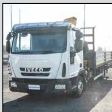
IVECO EUROCARGO 100E18 anno 2009, km 212515, cassone fisso con gru effer 75/4s € 32.000,00+lva RIF. RDDX689