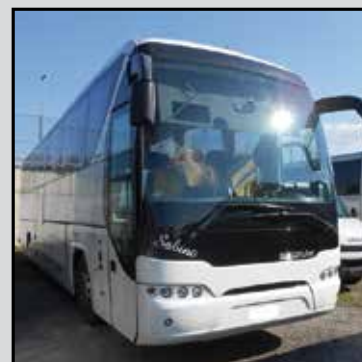
NEOPLAN N2216 SHD anno I immatricolazione 2009 versione Gran Turismo euro 4